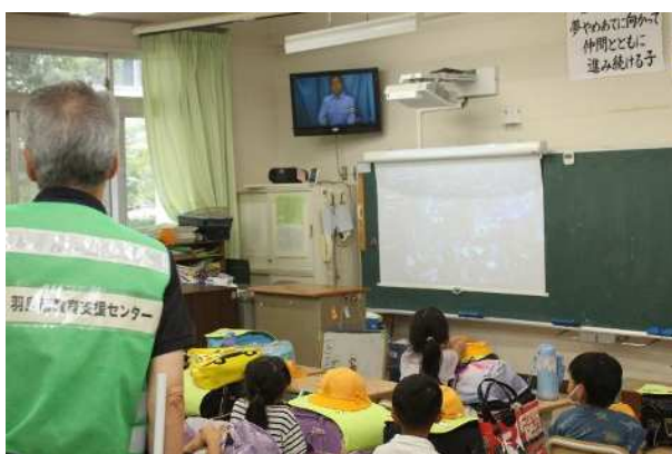
下校時の交通安全指導（7月）