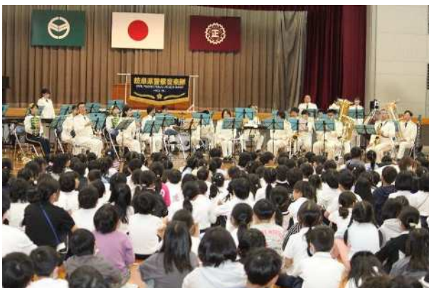
岐阜県警による交通安全教室（4月）