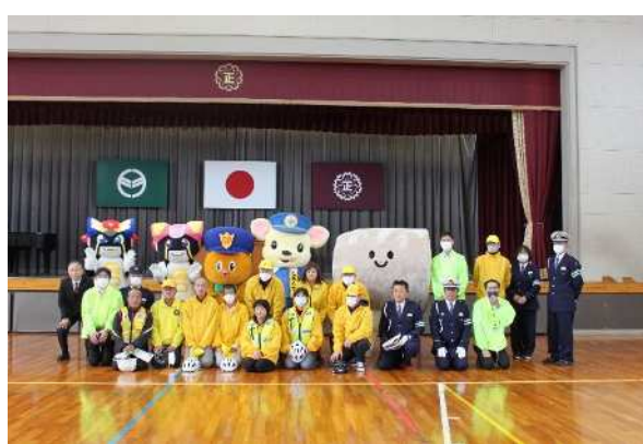
岐阜県警察本部等の関係機関と着ぐるみ