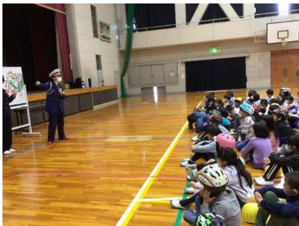
交通安全指導員による交通安全教室（4月）