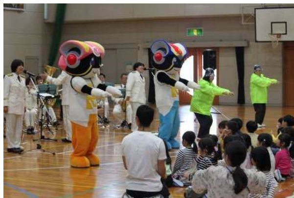
ヘルメット着用推進運動「カリメロプロジェクト」