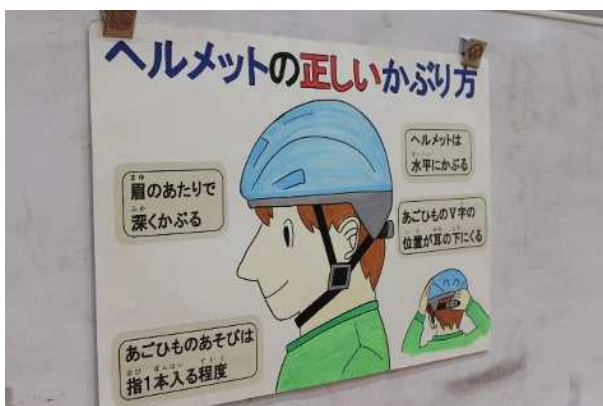
市交通安全指導員による交通安全教室（4月）