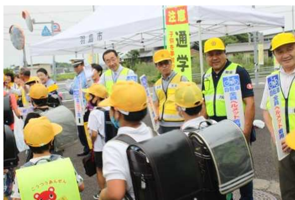
講話の後、下校時の児童の見守り活動