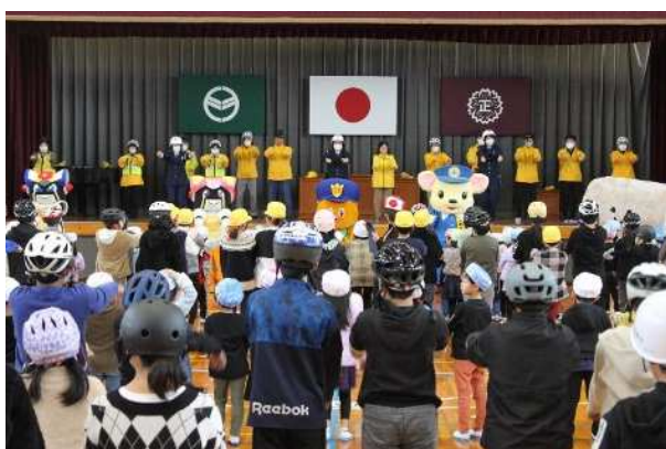
カリメロプロジェクト（11月）