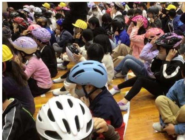
マイヘルメットを着用して参加する児童