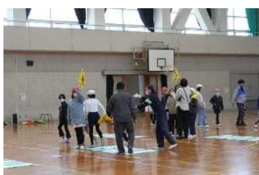
班長と副班長への交通安全指導（4月と3月）