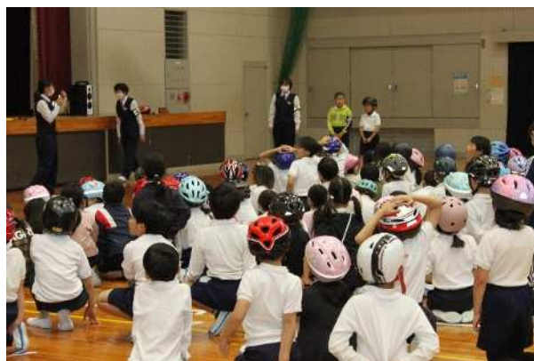
マイヘルメットを持参して参加する児童