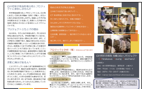
図2 プロジェクト参加募集チラシ

そこで、町教育委員会の学校教育係がファシリテーターとなり、校長会を通じて参加を募ることとした。