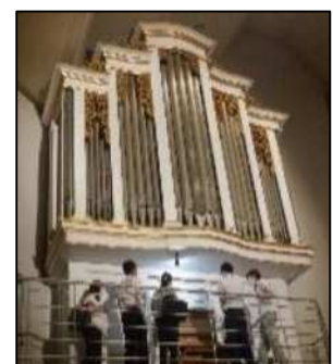
図4 パイプオルガン見学

白川町の伝統文化である地歌舞伎の東座や、町の自慢であるパイプオルガンの制作工房、最先端ドローン技術を活用した事業など、様々なジャンルの施設を訪問し、説明を受けたり、実際に体験したりすることができた。今回、町内各施設を巡り、そこでの出会いを通して、単に白川町について深く知るだけにとどまらず、その魅力を肌で感じ、白川町を愛する気持ちを高めることができた。