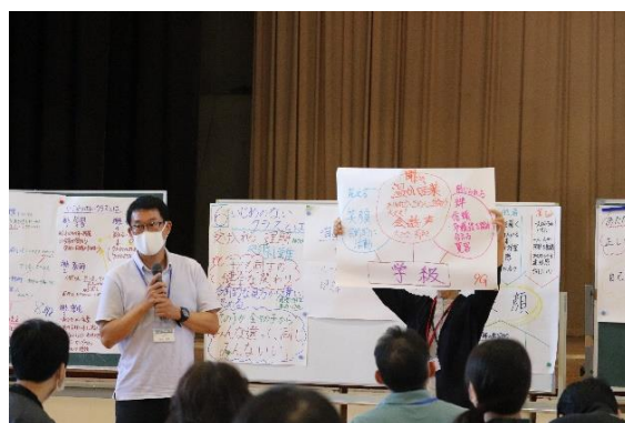
ライフスキル教育